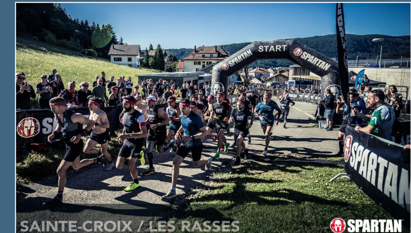
SAINTE-CROIX / LES RASSES

En attendant de se dépasser en 2023, je vous souhaite de trouver le plaisir, la motivation et la détermination nécessaires pour vous préparer à affronter les obstacles qui se dresseront sur votre chemin