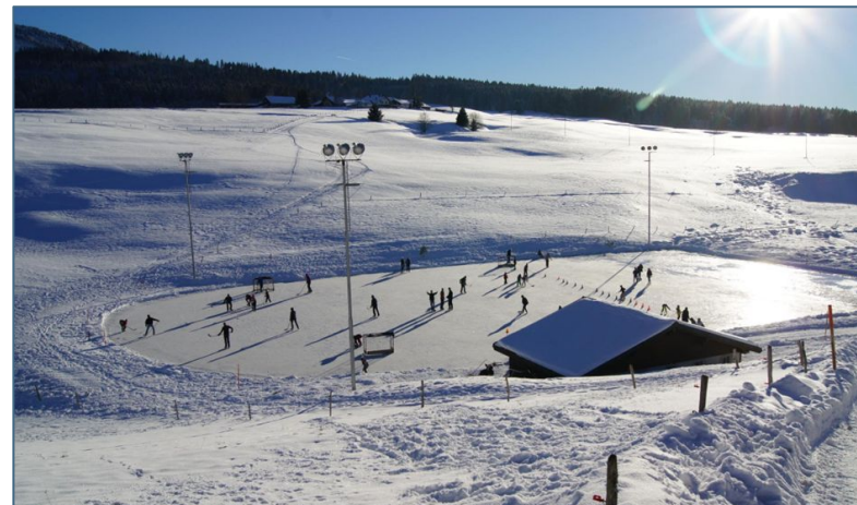
Patinoire naturelle de L'Auberson

Sans ces sociétés et leurs bénévoles qui s'engagent pour faire rayonner notre région, rien ne serait possible! Je souhaite à toute notre population une belle année 2023, et c'est ensemble que nous pourrions réaliser de grandes choses pour notre région.