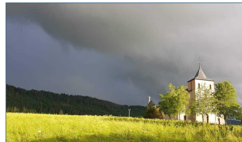
Temple de la Chau

Ainsi je vous souhaite de profiter d'instantanés privilégiés avec vos proches, d'apprécier les bonheurs de la vie, d'admirer les beautés de la nature et surtout de prendre soin de vous.