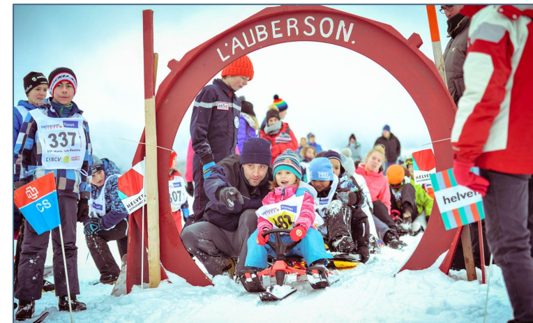
Course de luges à L'Auberson

Pour cette année 2023, dans notre contexte politico-social toujours plus compliqué, je souhaite que nous puissions voir le verre à moitié plein et garder un esprit constructif pour travailler ensemble sur les défis qui attendent notre société.