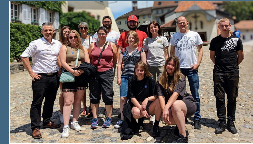
Sortie des apprentis 2022

Le passage de l'école au monde professionnel est délicat et il est de notre devoir de les accompagner sur la voie de la réussite. Il n'y a pas de plus belle satisfaction que de voir un apprenti obtenir son certificat. Que l'année 2023 vous apporte la santé et le succès dans vos différents projets !