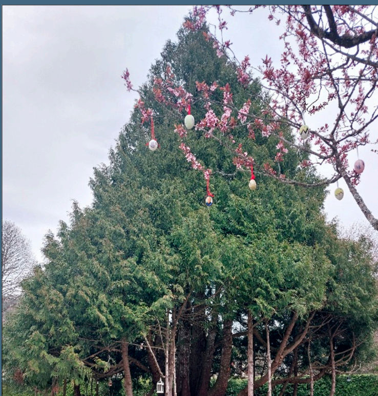
L'extraordinaire arbre dans la cour de l'EVAM.

Le café contact, qui accompagne et crée des ponts entre les personnes accueillies et la société d'accueil depuis presque le début de l'ouverture du foyer, crée une belle collaboration à tous les niveaux entre institutions et société civile.